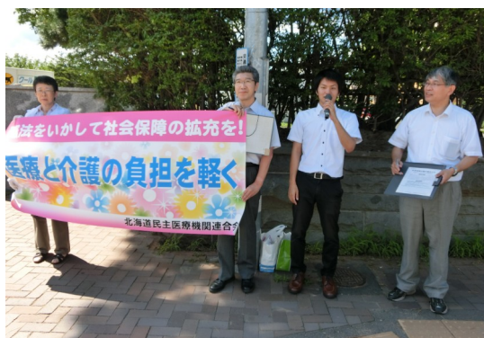
医療と介護の改善求める宣伝行動 (道民医連)

発刊から19年。多くの人たちに「輝く笑顔を!」「やむにやまれず立ち上がった怒りを」さらには「私たちがめざすべき平和と福祉の国への展望を」語っていただきました。